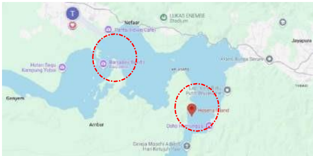
Gambar 1. Lokasi Penelitian

Pelaksanaan penelitian berlangsung dari bulan April hingga Mei 2025.