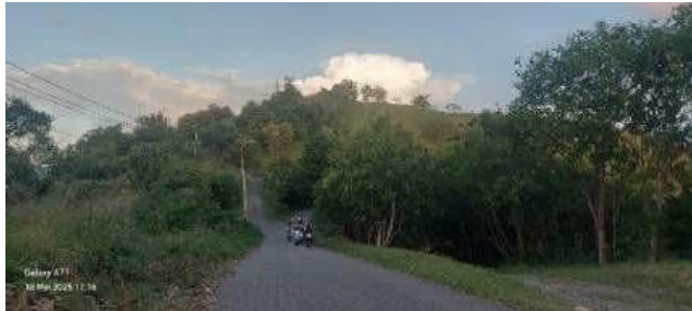
Gambar 7. Kondisi Jalan menuju Bukit Bhanjibey dan Tanjung Yobeh

Perencanaan pengembangan ekowisata di wilayah Danau sentani disusun dengan model SWOT yang melibatkan penilaian unsur internal dan eksternal. Ada empat aspek penting yang perlu diperhatikan, yakni: Kekuatan ( Strength/S ), Kelemahan ( Weakness/W ), Peluang ( Opportunity/O ), dan Ancaman ( Threat/T ). Tabel 2 memaparkan faktor-faktor internal dan eksternal yang berpengaruh terhadap pengembangan ekowisata Danau sentani.