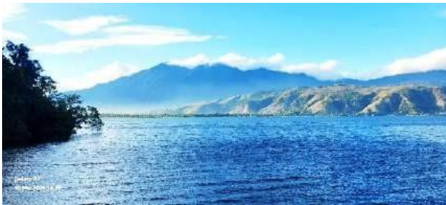
Gambar 2. Profil Danau Sentani

Suarka (2010 dalam Gunawan MA, 2021) menjelaskan bahwa potensi wisata mencakup segala hal yang dimiliki suatu wilayah dan berpotensi untuk dijadikan sebagai magnet wisata bagi para pengunjung. Potensi ini umumnya terbagi menjadi dua jenis, yaitu potensi budaya dan potensi alam. Potensi budaya mencakup unsur-unsur yang tumbuh dan berkembang dalam kehidupan masyarakat, seperti: tradisi, kebiasaan, mata pencaharian, serta seni dan budaya lokal. Sementara itu potensi alam merujuk pada aspek fisik dan geografis wilayah, termasuk keanekaragaman tumbuhan dan satwa yang hidup di wilayah tersebut.