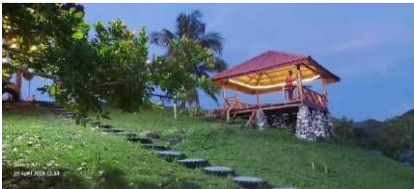
Gambar 6. Gazebo/Pondok di Bukit Bhanjibey