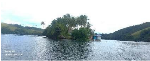
Gambar 5. Pulau Hosena