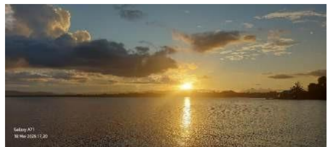
Gambar 4. Tanjung Yobeh

Danau Sentani di Papua menyimpan potensi besar sebagai destinasi ekowisata berkat keindahan alamnya, nilai-nilai budaya yang khas, serta kekayaan biodiversitas yang dimilikinya.