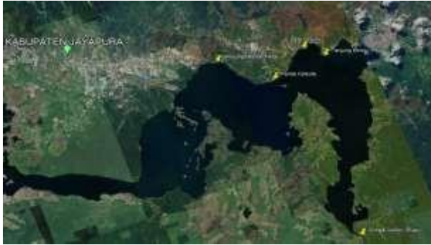
Gambar 1. Lima Lokasi Penelitian di Danau Sentani yang Memiliki Keramba (Pantai Khalkote, Nendali, Puay, Tanjung Elmo, dan Café Christo)