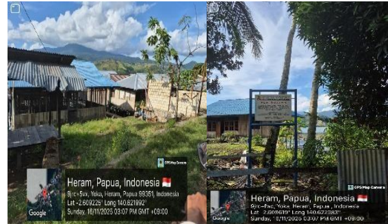
Gambar 5. Kondisi Lingkungan Permukiman di Pinggiran Danau