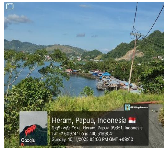
Gambar 2. Kampung Yoka