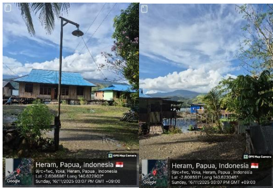
Gambar 3. Kondisi Rumah di Pinggiran Danau