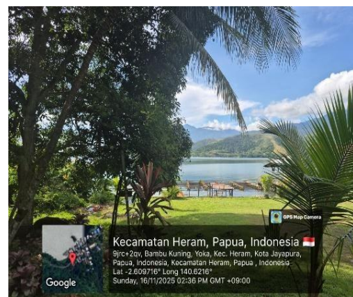
Gambar 4. Keramba Ikan

Selain aspek ekonomi dan kelembagaan formal, kondisi sosial Kampung Yoka juga sangat dipengaruhi oleh keberadaan dua sistem pemerintahan yang berjalan secara paralel, yaitu pemerintahan formal (kampung dan distrik) dan pemerintahan adat Hebaeibulu. Pemerintahan formal berperan dalam penyelenggaraan administrasi, pelaksanaan program pembangunan, serta hubungan dengan pemerintah daerah. Sementara itu, pemerintahan adat Hebaeibulu memiliki kewenangan dan legitimasi sosial dalam pengelolaan tanah ulayat, pengaturan pemanfaatan sumber daya alam, serta penyelesaian konflik sosial.