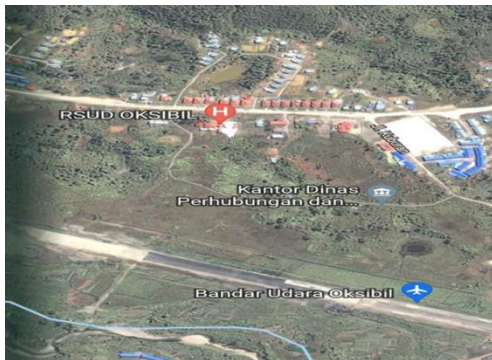
Gambar 1. Lokasi RSUD Oksibil

Bintang di Oksibil, pada bulan Desember 2021 hingga Februari 2022. Pendekatan yang digunakan dalam penelitian ini adalah pendekatan kualitatif yang dikuantitatifkan dengan menggunakan metode survei dan wawancara dan variabel penelitian adalah manajemen dan limbah Rumah Sakit. Informan dalam penelitian ini sebanyak 11 orang, yaitu antara lain: Direktur RSUD, Sekretaris BAPPEDA, Kabid P2PL DinKes, Kabid Lingkungan Hidup, Kabid Tata kota, Staf RSUD, Kepala Seksi LH, Staf RSUD, dan Kepala-Kepala Seksi RSUD. Untuk merumuskan strategi pengelolaan limbah Rumah Sakit, digunakan metode analisis SWOT.