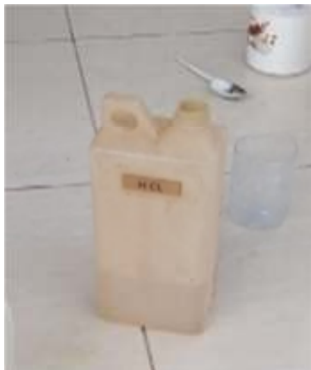
Gambar 6. Larutan HCl