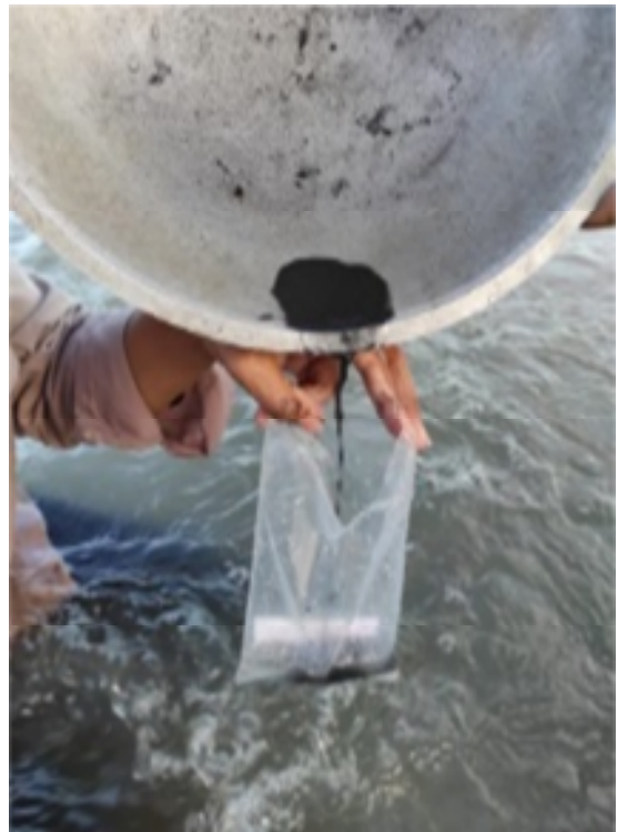
Gambar 3. Indikasi mineral logam dari kegiatan panning yang akan diuji di laboratorium.