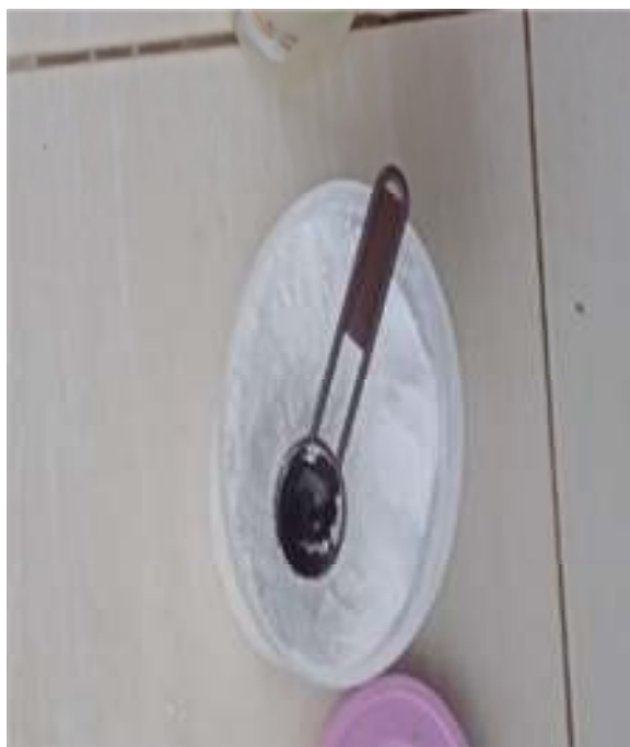
Gambar 4. Bubuk Sodium

Langkah pertama masukan sampel ke dalam wadah (buangnya air jika masi ada) setelah itu masukan larutan perbandingan 3:1 yang artinya larutan HCL-nya 3 mili sedangkan larutan Ntirit-nya 1 mili, kemudian biarkan agar cairan untuk mendeteksi logam jika kandungan ada makan kandungan logam tersebut akan ada kontras bergelembung dan menjadi residu/melebur, jika tidak ada reaksi apa-apa berarti tidak ada kandungan logamnya.