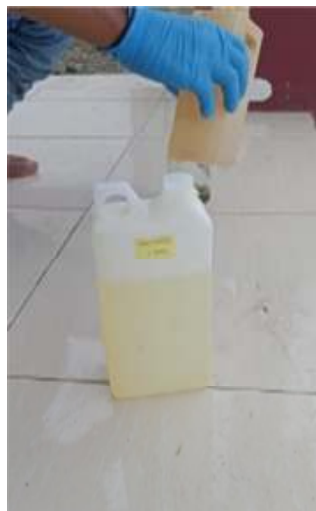
Gambar 6. Larutan Asam Nitrit