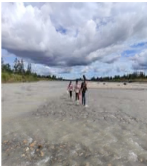
Gambar 7. Kenampakan Lokasi Penelitian

Berdasarkan hasil pendekatan morfografi pada daerah penelitian dominan terdiri dari perairan, pedataran (gambar 7). Aspek pembentukan lahan ini diketahui dengan memperhatikan parameter dari setiap topografi seperti bentuk lereng, bentuk lembah dan bentuk sungai.