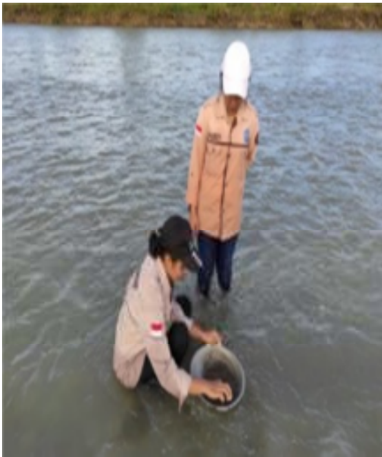
Gambar 2. Kegiatan Sampling

Adapun teknik pengambilan data penelitian yang digunakan yaitu sebagai berikut;