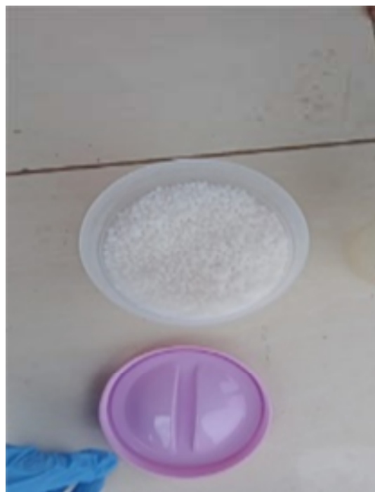
Gambar 5. Urea

Jika kurang jelas residu kandungan logamnya maka pindakan air larutan yang pertama ke wadah yang baru kemudian masukan lagi larutan urea dan sodium agar lebih jelas untuk melihat residunya. Metode ini hanya dilakukan untuk skala kecil.