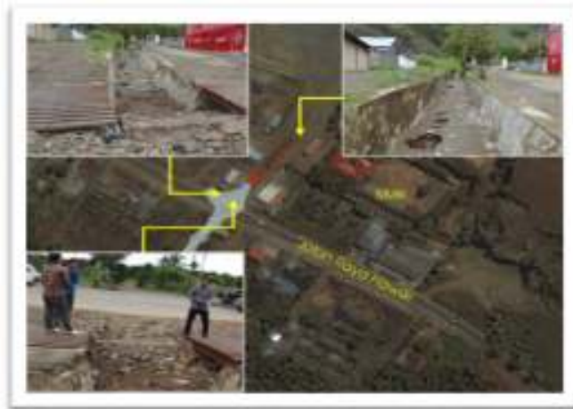
Gambar 5. Lokasi Genangan Depan SMK Sentani