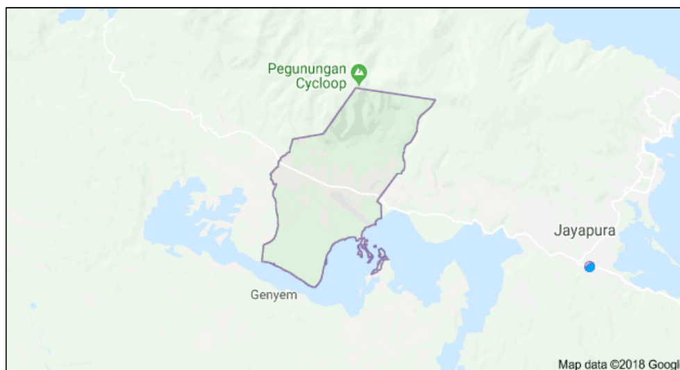
Gambar 1. Peta Lokasi Distrik Sentani [6]