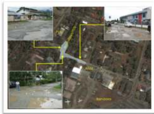
Gambar 3. Lokasi genangan depan PLN Distrik Sentani

Lokasi saluran drainase yang berada di depan Kantor Inspektorat, Jalan Raya Sentani yang memang merupakan daerah cekungan, sering mengakibatkan aliran air yang mengarah dan terkumpul di lokasi ini. Kondisi saluran sendiri