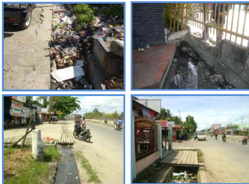
Gambar 6. Kondisi Saluran Drainase Di Wilayah Distrik Sentani Yang Dipenuhi Sampah

memadai. Distrik Sentani hanya memiliki 5 buah Tempat Penampungan Sampah Sementara (TPS) dengan kondisi yang tidak terawat. Akibatnya masyarakat masih menjadikan lahan kosong, saluran drainase ataupun pinggir jalan sebagai tempat pembuangan sampah, hal ini dikarenakan masih minimnya jumlah TPS di kawasan tersebut. Kondisi saluran drainase di wilayah Distrik Sentani yang dipenuhi sampah dapat dilihat pada Gambar 6 berikut ini.