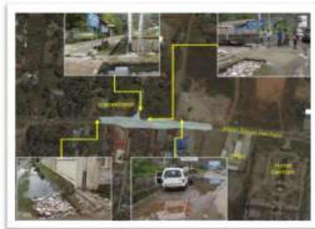
Gambar 4. Lokasi Genangan Di Depan Kantor Inspektorat Jalan Raya Sentani

banyak terdapat sedimen dan sampah akibatnya saluran tidak dapat berfungsi secara maksimal. Lokasi genangan yang terdapat di depan Kantor Inspektorat di Jalan Raya Sentani ditunjukkan pada Gambar 4 di bawah ini.