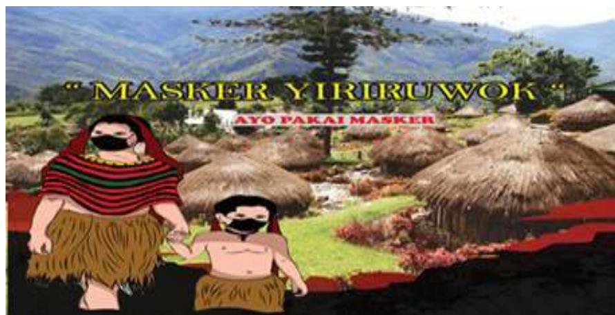
Gambar 7. Data Bahasa Paniai