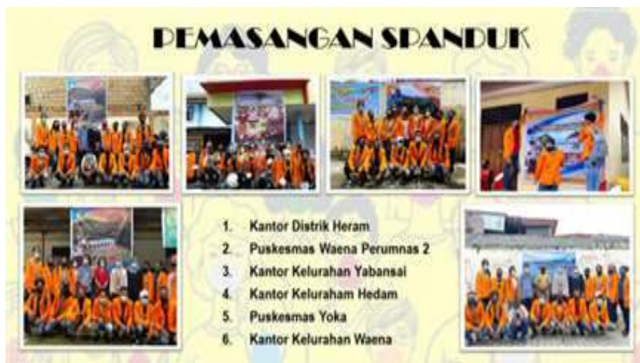
Gambar 8. Pemasangan Spanduk