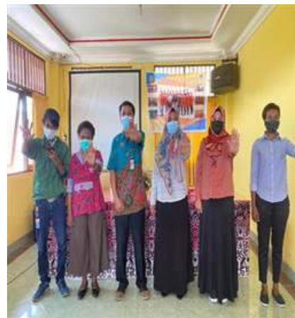
Gambar 1: Foto bersama Pihak Distrik Heram Dan Pihak Kelurahan Kota Jayapura