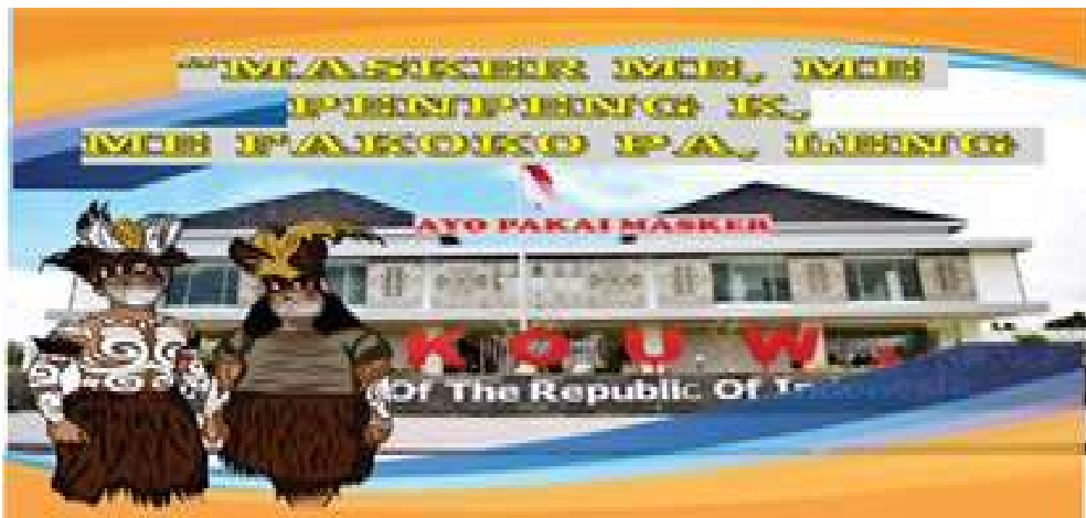
Gambar 4 : Bahasa Skow