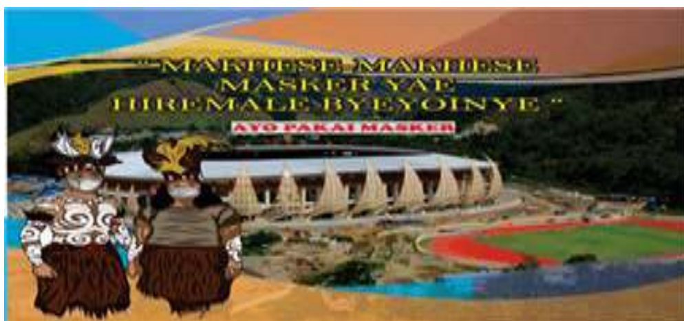
Gambar 5: Bahasa Sentani