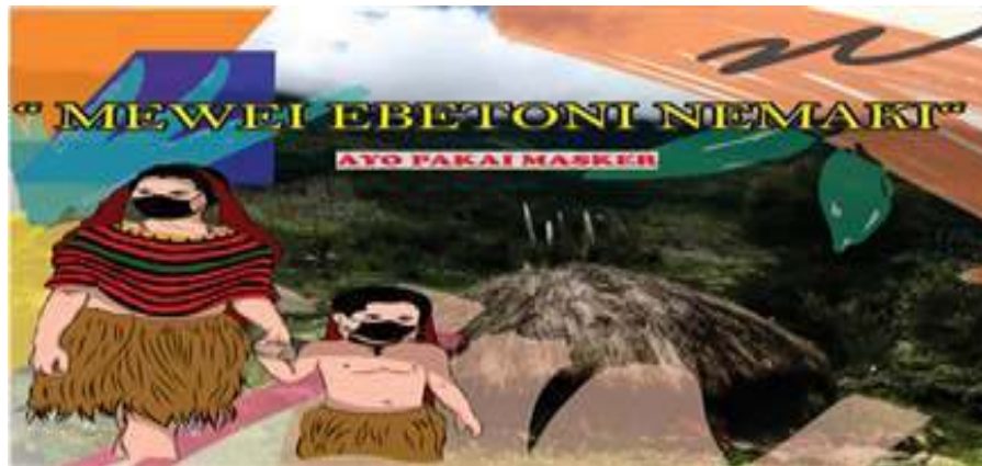
Gambar 6. Data Bahasa Mee