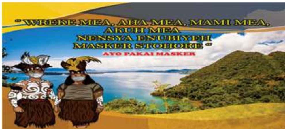
Gambar 3: Bahasa Nafri