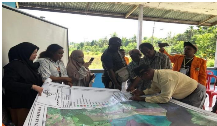
Gambar 9. Pengesahan Peta Kampung Oleh Kepala Kampung Kwadeware

Kegiatan ini merupakan tahap akhir dalam proses pemetaan batas administratif Kampung Kwadeware hingga tingkat RW dan RT. Kegiatan ini bertujuan untuk mengesahkan peta final sebagai dokumen resmi yang akan digunakan oleh Kampung Kwadeware untuk keperluan administratif, perencanaan pembangunan, dan pengelolaan wilayah. Peta yang disahkan dan diserahkan ini menjadi bukti konkrit hasil pendampingan pemetaan, sekaligus penanda bahwa proses pemetaan telah selesai dilaksanakan dengan partisipasi masyarakat.