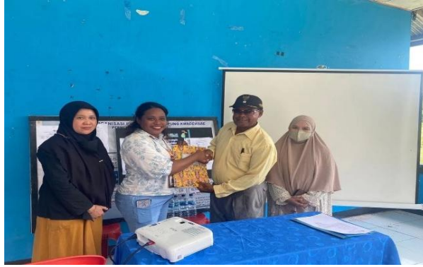
Gambar 10. Serah Terima Peta Wilayah Administratif Kampung Kepada Kepala Kampung Kwadeware