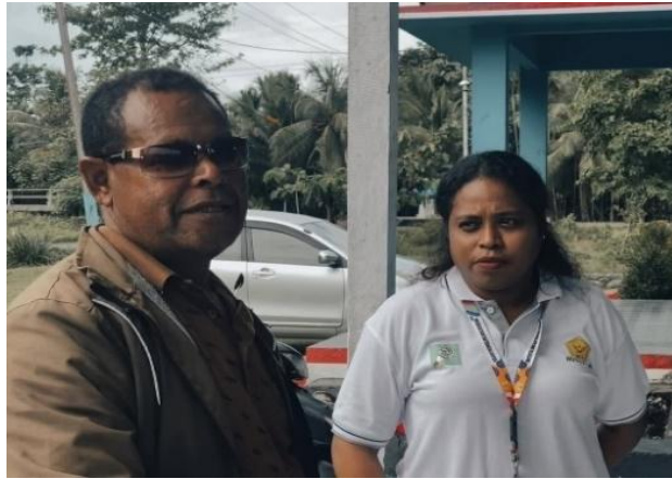
Gambar 2. Diskusi Bersama Kepala Kampung Kwadeware