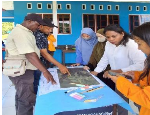
Gambar 8. Proses Crosscheck dan Validasi Peta