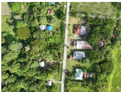
Gambar 4. Peta Citra Hasil Drone Lokasi Kampung Kwadeware

Selanjutnya dilakukan survei lapangan pada 8 (delapan) RW yang terletak di Kampung Kwadeware. Berikut ini adalah sebagian data hasil survei lapangan :