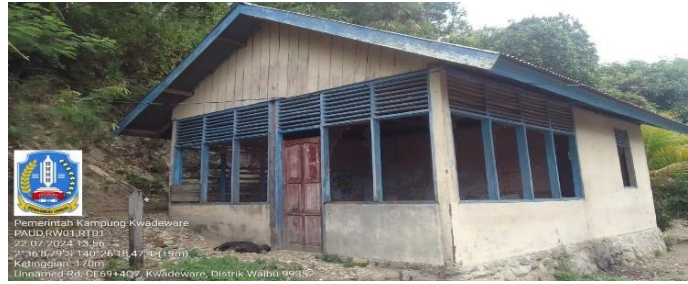
Gambar 5. Dokumentasi Hasil Survei Lapangan