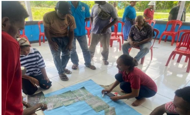
Gambar 3. Penyiapan Peta Dasar (Citra Lokasi) dan Informasi Dasar

Dalam tahapan ini, tim pelaksana melakukan pengecekan kelengkapan formulir data lapangan dan melakukan koordinasi untuk tahapan kegiatan berikutnya berupa pengambilan data spasial.