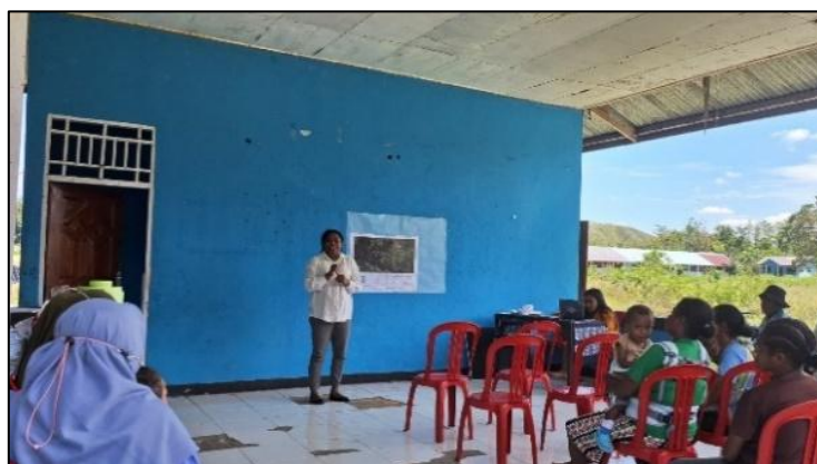
Gambar 7. Sosialisasi Hasil Pemetaan

Sosialisasi hasil pemetaan merupakan salah satu tahapan dalam proses pemetaan batas wilayah administratif Kampung Kwadeware hingga tingkat RW dan RT. Kegiatan ini bertujuan untuk menyampaikan hasil pemetaan yang telah disusun dan divalidasi kepada seluruh masyarakat kampung, tokoh adat, pemerintah kampung, serta pihak terkait lainnya. Sosialisasi ini penting untuk memastikan bahwa hasil pemetaan diterima dengan baik oleh masyarakat dan menjadi dasar yang sah dalam perencanaan dan pengelolaan wilayah kampung.