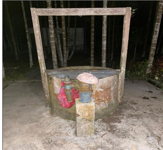
Gambar 1. Sumur Yang di Gunakan Masyarakat Kampung Suskun

terjadi dengan cara menghambat partikel-partikel ke dalam ruang pori sehingga terjadi pengumpulan dan tumpukan partikel tersebut pada permukaan butiran media. Dengan tumpukan partikel yang melekat pada butiran media ini akan menjernihkan air dari kekeruhan dan menjadi lebih bersih (Mashadi et al. , 2018). Sesuai dengan solusi yang diberikan untuk mengatasi permasalahan air yang dihadapi oleh masyarakat kampung Suskun (khususnya RT 1 dan 2), maka tim PkM merancang sistem filtrasi air minum.