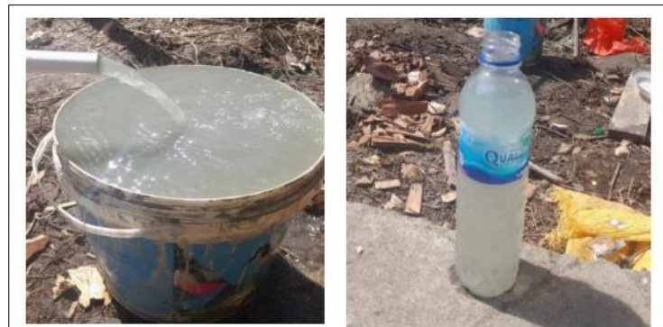
Gambar 2. Air sumur yang keruh, berwarna dan berbau di Kampung Suskun