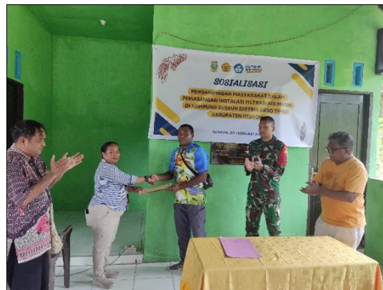
Gambar 7. Penyerahan Satu (1) Unit Instalasi Air Minum Kepada Kepala Kampung Suskun