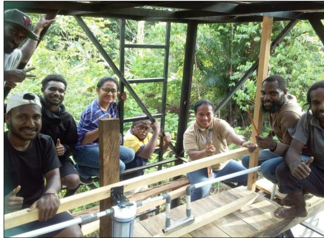
Gambar 4. Pemasangan Instalasi Air Minum

Pemasangan instalasi air minum dilaksanakan dengan menginventarisir peralatan yang dibutuhkan. Setelah bahan yang digunakan lengkap maka dimulailah kegiatan instalasi dengan menyusun satu per satu peralatan yang dibutuhkan dalam kegiatan pengabdian ini seperti yang dapat dilihat pada Gambar 4. Hasil penggunaan instalasi air buat Masyarakat, air siap digunakan untuk kebutuhan keluarga (Gambar 5.)