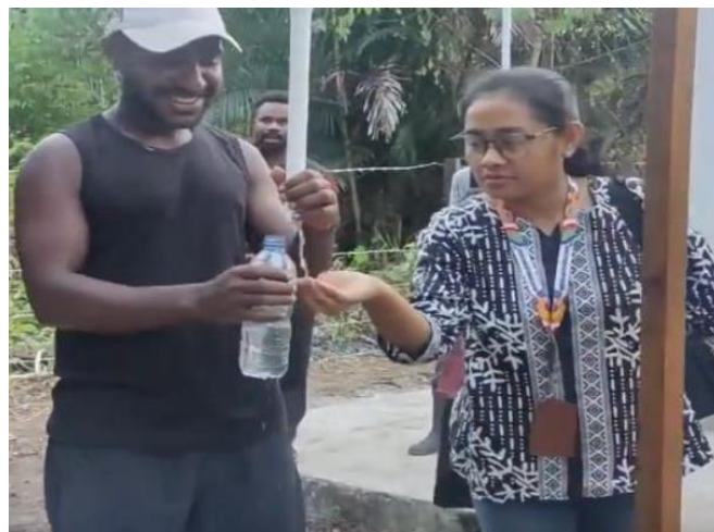
Gambar 5. Hasil Filtasi Air Minum Buat Masyarakat Kampung Suskun