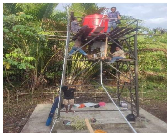
Gambar 8. Satu Unit Instalasi Air Minum