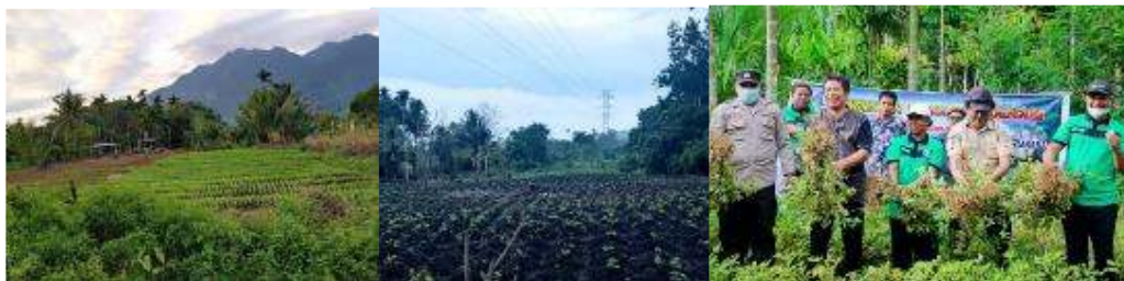
Gambar 1. Potensi Pertanian dan Kelompok Tani di Kampung Sereh

Saat ini Kampung Sereh belum memiliki data profil kampung yang diperbaharui padahal dokumen ini diperlukan sebagai dasar penentuan berbagai program pembangunan yang akan dilaksanakan di Kampung Sereh. Profil kampung merupakan salah satu informasi yang lengkap terkait pengembangan kampung yang meliputi data potensi kampung baik sumber daya alam, manusia, kelembagaan, sarana dan prasarana. Data profil kampung diperlukan dalam menyusun program-program pembangunan dalam bentuk rencana pembangunan jangka menengah kampung (RPJMK) dan rencana kerja pembangunan tiap tahunnya (RKPK), dan dituangkan dalam anggaran pendapatan dan belanja kampung (APBK).