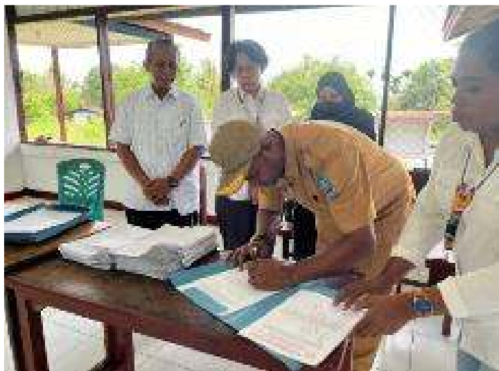
Gambar 8. Kegiatan Konsultasi dan Penyerahan Draf Profil Kampung Sereh

Setelah melakukan kompilasi data-data hasil survei dan menyusun Draf Dokumen Profil Kampung, kemudian tim dosen melakukan konsultasi dan menyerahkan Draf Profil Kampung kepada mitra (Gambar 8).