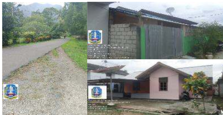
Gambar 7. Dokumentasi Hasil Survei Lapangan