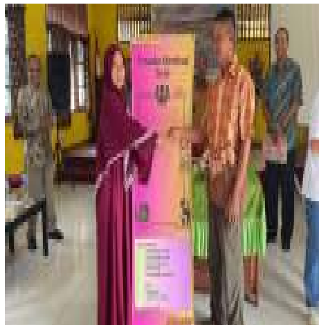
Gambar 7. Banner Prosedur Penggunaan Aplikasi Administrasi Surat Menyurat

Banner prosedur aplikasi administrasi surat menyurat menampilkan prosedur pembuatan surat menyurat di Kantor Kampung Holtekamp seperti surat keterangan domisili, surat keterangan usaha, surat keterangan kematian, surat rekomendasi dan surat keterangan tidak mampu. Banner tersebut dibuat agar masyarakat dan Aparat Kampung dapat mengetahui alur pembuatan surat menyurat di Kantor Kampung Holtekamp, dengan menggunakan aplikasi sistem informasi (gambar 7).