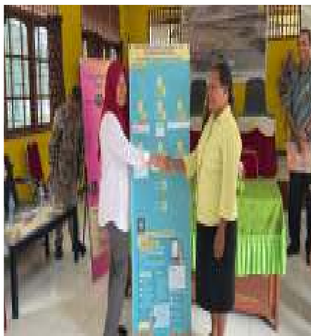
Gambar 8. Banner Prosedur Penggunaan Pace Mace Dukcapil

diri dan berkas SKP dan KK, hingga pengambilan KTP di Kantor Dukcapil. Tujuannya adalah untuk membantu masyarakat Kampung dengan mudah mengakses halaman web Pace Mace Dukcapil dan mengajukan permohonan pembuatan surat sesuai dengan yang dibutuhkan (gambar 8).