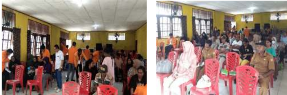
Gambar 4. Pendampingan Penggunaan Aplikasi Sistem Informasi dan Aplikasi Pace Mace Dukcapil

Dalam pelaksanaan sosialisasi tersebut kami tim Dosen PkM bersama mahasiswa sekaligus melakukan pendampingan secara langsung kepada seluruh peserta sosialisasi tentang penggunaan aplikasi sistem informasi dalam pengurusan surat menyurat yang dibutuhkan masyarakat di Kantor Kampung Holtekamp. Dan juga mendampingi dalam penggunaan aplikasi kependudukan Pace Mace Dukcapil agar dapat mempermudah tugas yang dilakukan oleh Pemerintah Kampung Holtekamp (gambar 4).