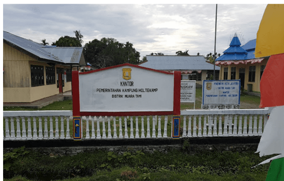
Gambar 1. Kantor Kampung Holtekamp

Lokasi Kampung Holtekamp (gambar 1) terletak di Distrik Muara Tami, Kota Jayapura. Wilayah Kampung Holtekamp terbagi dalam 3 (tiga) lingkungan Rukun Warga (RW) dan terdiri dari 9 Rukun Tetangga (RT).