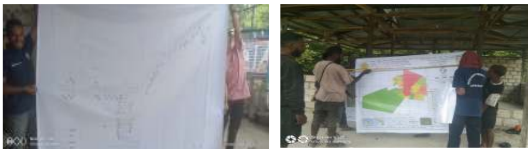
Gambar 6. Peta yang telah dicetak