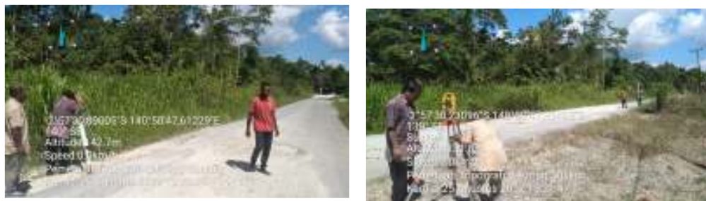
Gambar 3. Proses Pengukuran

Langkah berikutnya adalah melakukan pengukuran poligon. Hal ini mempunyai maksud dan tujuan untuk menjadikannya sebagai acuan dalam mengetahui titik kontrol pada semua rincian lokasi yang akan diukur. Metode yang digunakan dalam pengukuran poligon adalah dengan menggunakan metode poligon terbuka terikat. Pengukuran polygon diawali dengan membuat tanda awal pada titik dimulainya pengukuran. Selanjutnya melakukan pengukuran baseline yaitu dengan membentangkan garis ke tengah area yang terpasang setiap 100 meter atau lebih sesuai dengan kondisi lapangan. Kemudian penggunaan patok-patok baseline ini agar mempermudah dalam melakukan monitor setiap pekerjaan. Pengukuran lapangan yang merupakan sebagai target adalah berupa ketinggian lokasi dari permukaan air laut. Setelah itu pengukuran jalan-jalan utama, jalur-jalur setapak, sungai, aliran air, selokan, perumahan rakyat dan fasilitas pemerintah kampung dan lain sebagainya seperti pada gambar 3.