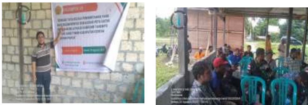
Gambar 8. Sosialisasi Good Governance

Sosialisasi terkait Good Governance dibawakan langsung oleh dosen Prodi Hubungan Internasional lewat kegiatan pengabdian masyarakat. Dalam sosialisasi ini digunakan satu buah baliho selain materi berupa power point yang menggambarkan prinsip-prinsip dan indikator -indikator Good Governance sehingga dapat memudahkan masyarakat memahami penjelasan tentang Good Governance atau tata kelola pemerintahan yang baik. Hal ini sejalan dengan pandangan Mardiasmo (2009) bahwa Good Governance sebagai tata cara suatu negara yang digunakan untuk mengelola sumber daya ekonomi dan sosial yang berorientasi pada pembangunan masyarakat demi mewujudkan pemerintahan yang baik 3 . Kegiatan sosialisasi dimaksud dapat dilihat pada gambar 8.