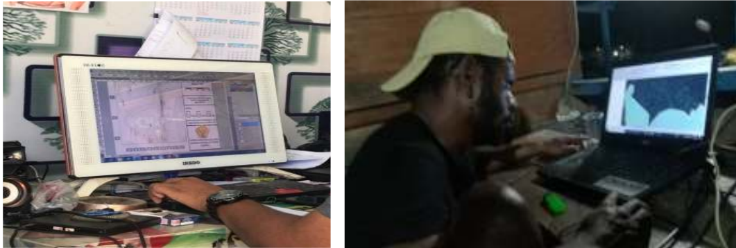
Gambar 4. Proses Pengolahan Data

Langkah selanjutnya ini menggunakan alat ukur theodolit dan roll meter sebagai alat ukur untuk mengukur titik-titik detail. Cara pengukuran dan pembacaan alat ukur sama dengan pengukuran polygon utama. Pada gambar 4 terlihat proses pengolahan data untuk menghasilkan peta.