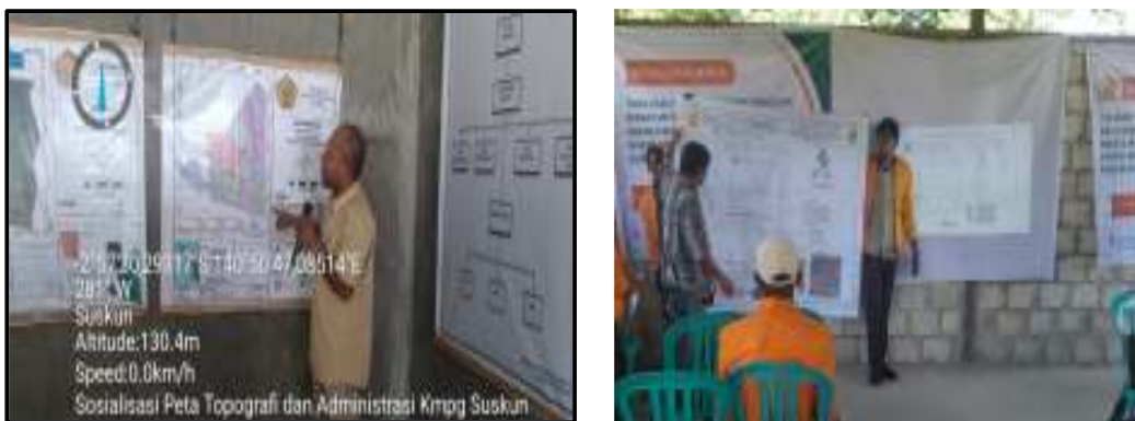
Gambar 7 Sosialisasi Manfaat Peta

Sosialisasi menjadi kegiatan terakhir yang dilakukan dalam kegiatan Pengabdian Kepada Masyarakat ini yang dihadiri oleh perangkat kampung dan masyarakat setempat, yang mana dalam hal ini sosialisasi yang disampaikan adalah tentang cara membaca peta topografi, peta situasi dan peta administrasi serta manfaatnya bagi pemerintah dan masyarakat dan bagaimana mempraktekkan system pemerintahan yang baik seperti yang terlihat pada gambar 7.