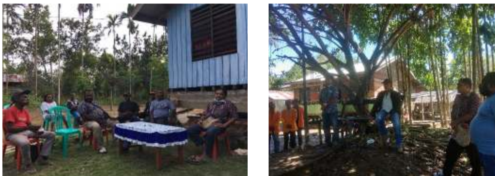
Gambar 1. Diskusi dengan Warga dan Perangkat dusun Yanemyo Kampung

Berdasarkan hasil survey dan diskusi dengan masyarakat Dusun Yanemyo, Kampung Suskun Distrik Arso Timur diketahui bahwa kampung yang terdiri atas RT 3, RT 4 dan RT 5 tersebut dalam proses pemekaran namun masih terkendala pada beberapa dokumen dan kurangnya pemahamann serta pengetahuan terkait prinsip-prinsip tata kelola pemerintahan yang baik ( good governance) bagi perangkat kampung dan masyarakat. Berikut ini adalah dokumentasi wawancara dengan warga dan perangkat Dusun Yanemyo kampung Suskun distrik Arso Timur kabupaten Keerom yang dilaksanakan pada tanggal 24 Juni 2023.