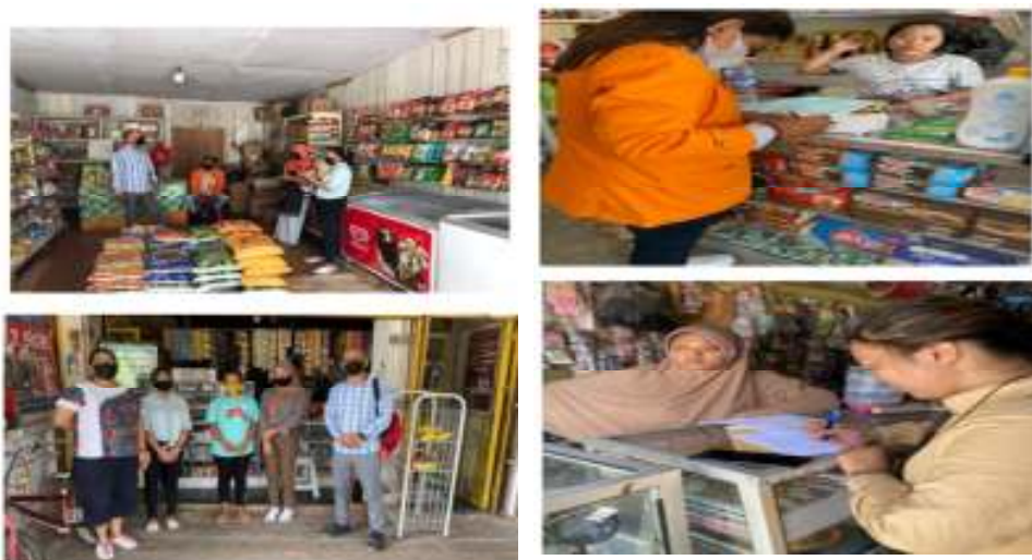
Gambar 2. Pendampingan pencatatan Akuntansi dan Penggunaan Aplikasi Buku Kas