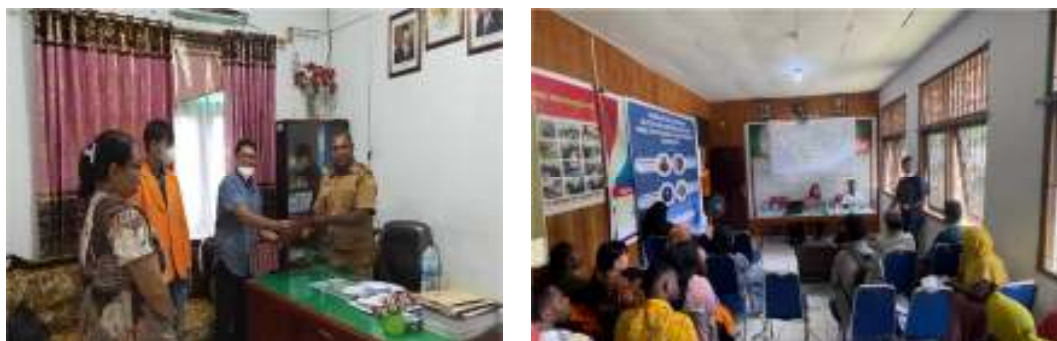
Gambar 1. Penyampaian Materi Akuntansi Koperasi dan Aplikasi Buku Kas

Kegiatan Pelatihan dan pendampingan mulai dilakukan pada tanggal 01 Februari 2021, Kegiatan ini diikuti oleh 14 pengusaha dari berbagai jenis bidang usaha. Sebelum dilaksanakan pelatihan dan pendampingan, tim pengabdian melakukan observasi dan survey terhadap responden yang bersedia mengikuti pelatihan dan pendampingan selama 1 bulan. Dari hasil survey yang diperoleh ada 19 pemilik usaha dan 3 pengurus koperasi yang bersedia mengikuti pelatihan dan pendampingan. Langkah selanjutnya adalah Pengenalan dan pemberian materi terkait aplikasi keuangan Buku Kas dan dasar dasar akuntansi mulai dari penjurnalan sampai dengan penyusunan laporan keuangan. Materi yang diberikan antara lain cara mengoperasikan aplikasi buku kas yang terdiri dari cara mencatat atau menginput transaksi, mencatat atau menginput harga pokok, mencatat atau menginput pengeluaran, mencatat atau menginput stok barang, dan Melihat Laporan Keuangan baik mingguan, bulanan maupun tahunan.