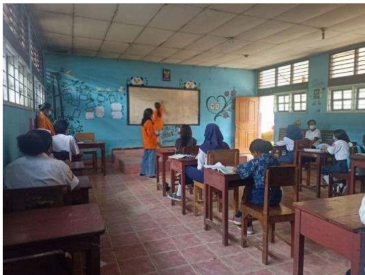
Gambar 5. Penjelasan Materi tentang Akuntansi