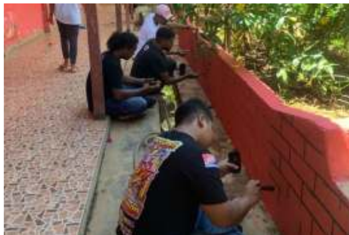
Gambar 9. Proses Pengecatan