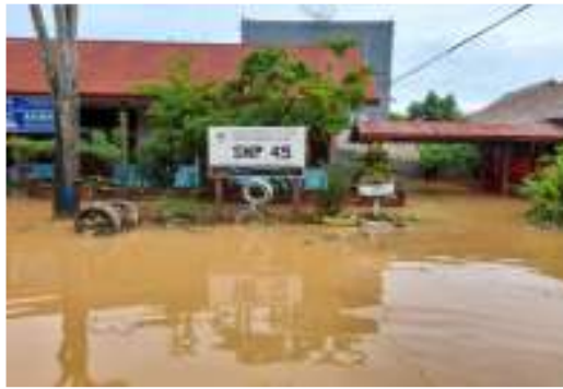
Gambar 2. Situasi Banjir di SMP 45 kota Jayapura awal tahun 2022

SMP 45 Entrop berada di sekitar pemukiman masyarakat padat penduduk dan merupakan dataran rendah sehingga sangat berpeluang mengalami banjir.[4] Pada tahun 2022 awal sebagian besar kelurahan di kota jayapura mengalami banjir, termasuk daerah lokasi SMP 45 Entrop. Oleh karena itu pihak sekolah sangat membutuhkan bantuan untuk menata kembali lingkungan sekolah pasca banjir. Akibat banjir ada beberapa ruangan yang tidak bisa digunakan lagi serta fasilitas-fasilitas sekolah yang rusak sehingga proses belajar mengajar sehari-hari terganggu.