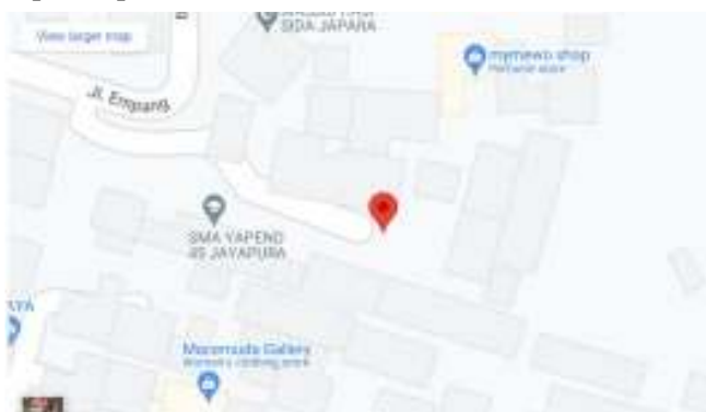
Gambar 1. Lokasi SMP 45 Entrop

SMP 45 Entrop merupakan sekolah yayasan pendidikan yang berada di Jl. Feri 4-5 Entrop, Entrop, Kec. Jayapura Selatan, Kota Jayapura Provinsi Papua. SMP 45 juga merupakan sekolah satu atap dengan SD dan SMA 45. SMP 45 memiliki total 10 guru yang terdiri dari 9 guru PNS dan 1 guru honorer serta siswa siswi sebanyak 76 orang yang terdiri dari 47 siswa laki-laki dan 29 siswa perempuan.