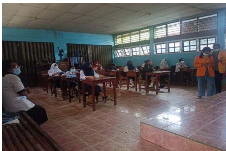
Gambar 6. Penjelasan Tata Kelolah Keuangan

Selain itu, diberikan juga penjelasan kepada siswa bagaimana cara mengelola keuangan yang baik dan benar. Bukan hanya tata kelola keuangan perusahaan tetapi bagaimana mereka mengatur keuangan mereka sendiri serta gambaran tentang fungsi tersendiri dari pajak yang berguna dalam tata pembangunannegara bahkan sekolah dan pembangunan pemerintah lainnya.