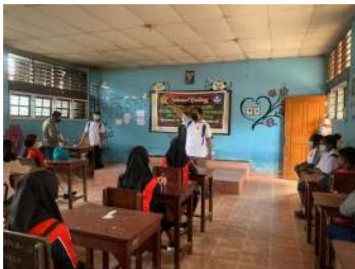
Gambar 4. Penyampaian Materi Kepramukaan kepada Siswa Siswi

Kegiatan yang dilakukan di SMP 45 Entrop adalah Mengajarkan dasar-dasar seperti kesopanan, menghormati yang lebih tua, peraturan baris berbaris, semaphore, simpul tali, dan juga sandi kotak. Praktek yg dilakukukan itu menggunakan cara permainan, sehingga para siswa/siswi berlomba lomba untuk melakukan praktek dengan baik juga berusaha mendengar kan materi dengan baik