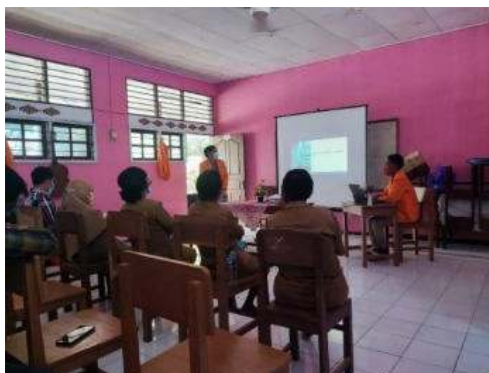
Gambar 3. Sosialisasi Wirausaha Berbasis IT

Dalam kegiatan pengabdian kepada masyarakat ini, diperkenalkan kepada guru-guru bagaimana cara memulai berwirausaha menggunakan teknologi informasi, apa saja yang perlu diperhatikan dalam berwirausaha dengan IT atau secara umum bisa di bilang usaha online. Kami juga memberi tips tips ke guru-guru tentang bagaimana agar bisnis itu dapat dipercaya. Adapun aplikasi-aplikasi yang kita sarankan untuk memulai berwirausaha seperti WhatsApp Facebook dan Instagram