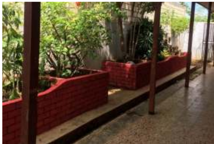
Gambar 8. Taman Sekolah setelah Penataan Pasca Banjir