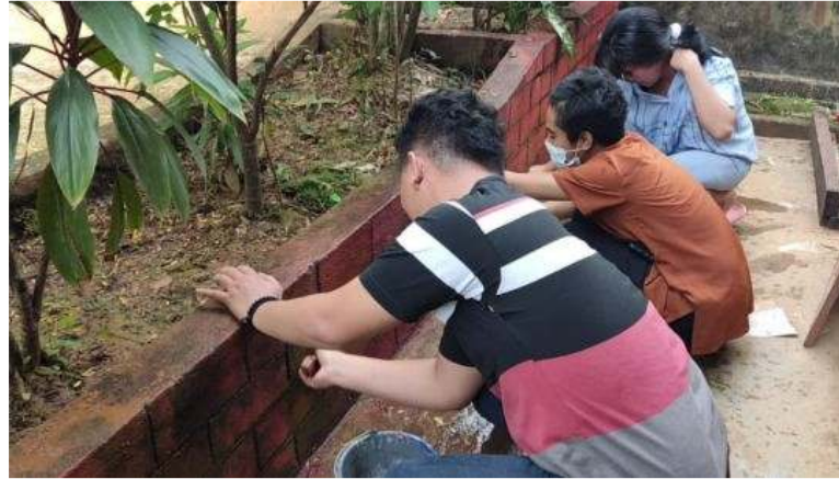
Gambar 7. Proses Pembersihan Taman.

hari. Hal itu dikarenakan keterbatasan alat cat, kuas yg digunakan hanya sebanyak 4 kuas cat. Proses pengerjaan pengecatan pun dilakukan hanya setelah Kegiatan Belajar Mengajar selesai agar tidak mengganggu konsentrasi para guru dan siswa/siswi. Proses pengecatan dilakukan secara bergantian antar anggota kelompok sehingga pekerjaan yg dilakukan bisa lebih efisien. Proses pengecatan bergantian juga dilakukan karena keterbatasan alat.