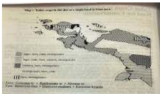
ambar 2. Peta Penyebaran Pola Pangan Pokok di Tanah Papua.

Pendekatan Agroekosistem dapat pula dilihat dari aspek pola pangan utama, tanaman spesifik lokal penghasil karbohidrat yang digunakan masyarakat setempat dan telah lama berlangsung secara turun temurun, seperti yang kemukakan La Achmady dan Jurg Schneider (1990) [31], dalam : Tuber Crops in Irian Jaya : Diversity and the Need for Conservation pada Seminar Internasional : Indigenous Knowledge in Conservation of Crop Genetic Resources , menyatakan terdapat 5 (empat) pola pangan pokok tanaman yang dibudidaya sebagai sumber penghasil karbohidrat, sebagai berikut :